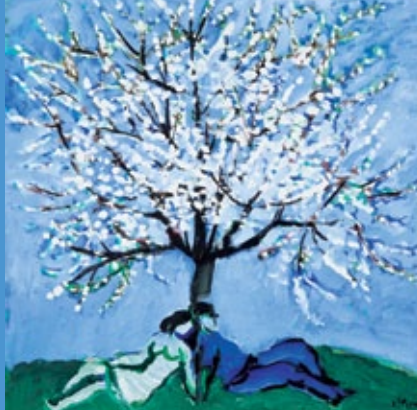
dipinto di Sergio Altieri

Premio Letterario Internazionale "Comonslibri" (già Premio Letterario internazionale "Vilegnovella dal Judri", uno dei maggiori in Italia con otto edizioni e medaglia d'argento del Presidente della Repubblica). Il tema dell'edizione è "Utopia, disincanto, speranza" e la partecipazione al concorso, libera e gratuita, aperta a tutti a prescindere dalla nazionalità, luogo o idioma e possono partecipare autori che abbiano compiuto il 16° anno.